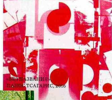
«БЕТАЗВАНΙΑ» ПΑΝΟΣ ΤΣΑΓΑΡΙΣ, 2016

Одна из моих любимых римских галерей современного искусства – Galleria Maria-Laure Fleisch – до января принимает греческого художника Паноса Театариса. Via di Pallacorda, 15