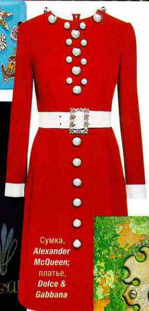
Сумка, Alexander McQueen; платье, Dolce & Gabbana