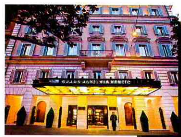
РЕСТОРАН MAGNOLIA СЛЕВА. ВХОД В ОТЕЛЬ