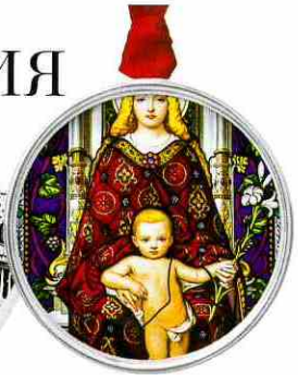
СОБОР СВЯТОГО ПЕТРА