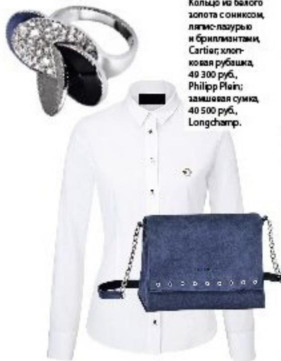
Кольцо из белого золота с ониксом, ляпис-лазурью и бриллиантами, Cartier; хлопковая рубашка, 40 300 руб., Philipp Plein; замшевая сумка, 40 500 руб., Longchamp.

Цена: от €2350 за ночь в сюите «Мужчина и женщина». www.hotelsbarriere.com