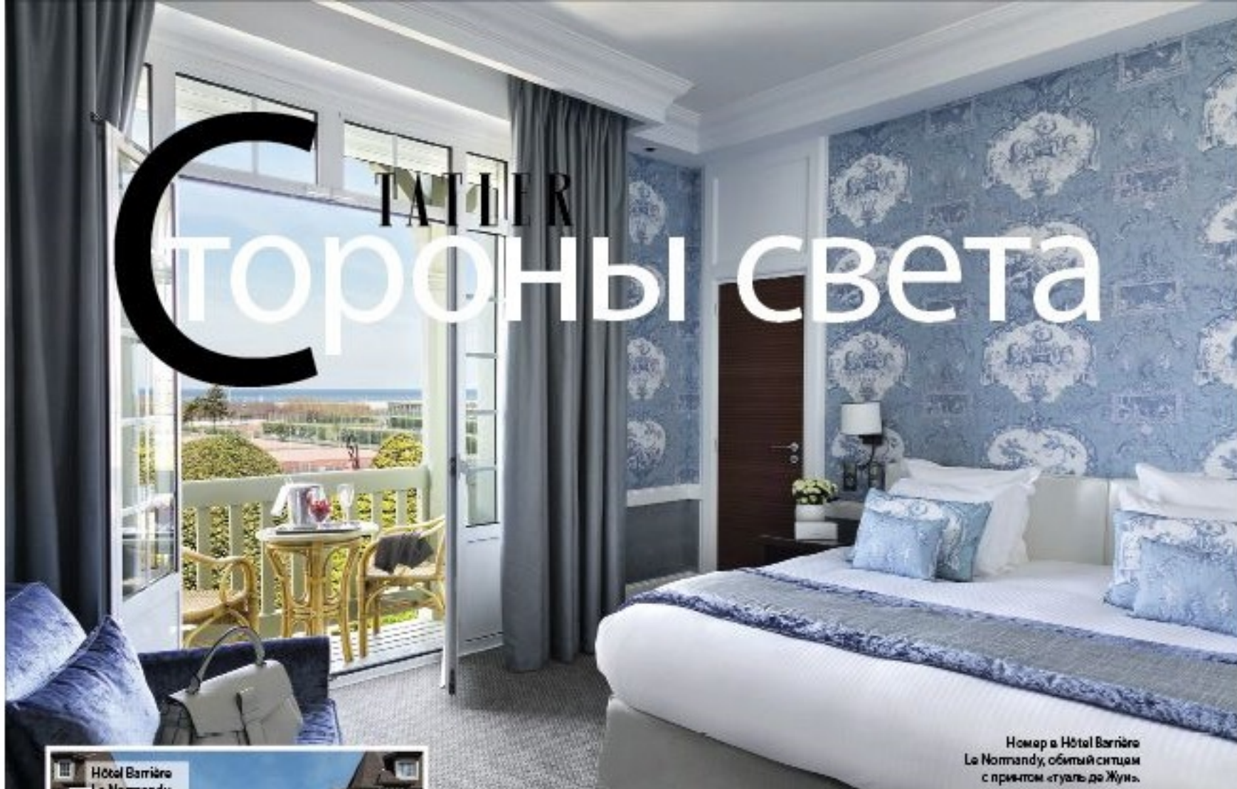
Номер в Hôtel Barrière Le Normandy, обитый ситцем с принтом «туаль де Жуи».