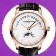
Vacheron Constantin Patrimony Moon Phase and Retrograde Date