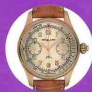
Montblanc 1858 Chronometer Tachymeter Limited Edition 100