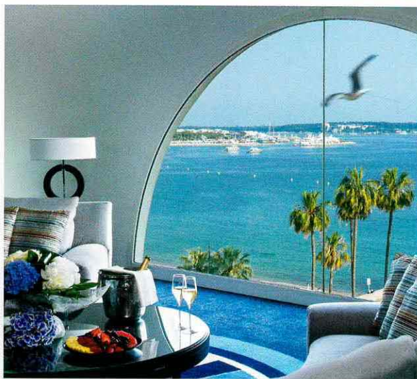
Сьют Mélodie подходит и для размеренного отдыха, и для работы.

Кстати, с 24 октября 2016-го по 31 марта 2017 года каждый гость, забронировавший номер с видом на город, без доплат получает номер повышенной категории с видом на море. Если учесть, что зимой в Европе не найти мягче климата, чем в Каннах, то такое предложение не стоит упускать.