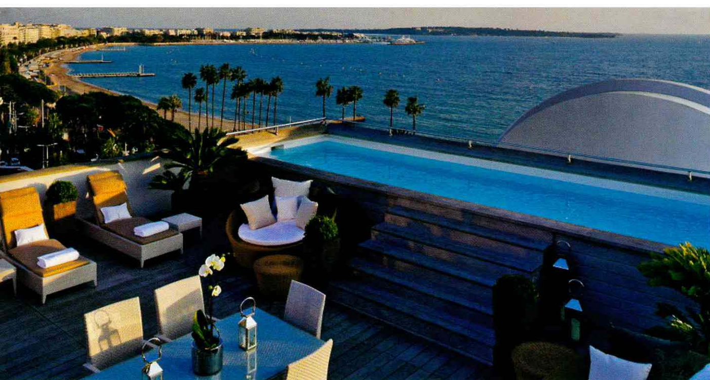
Бассейн на крыше — удовольствие, доступное далеко не каждому путешественнику.