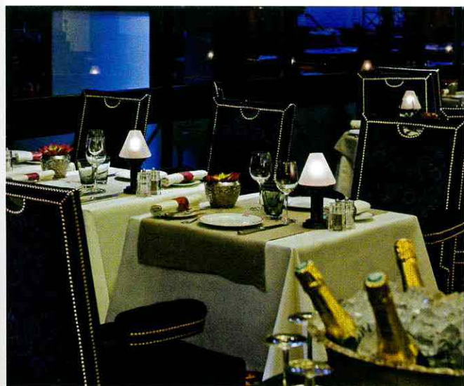
В отеле работают три ресторана, включая знаменитое brasserie Fouquet's.