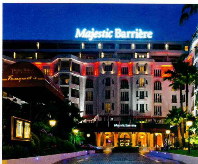
На постройку нового крыла отеля было потрачено €80 млн.

Этим летом Hotel Barrière Le Majestic Cannes представил долгожданную премьеру — новый формат семейного отдыха, студию Le Studio by Petit VIP. Здесь гости вместе с детьми смогут посетить мастер-классы, где их обучат иностранным языкам и предложат попробовать свои силы в нескольких видах искусств. Скульптура и фотография, этикет и правила сервировки стола, музыка и кинематограф — дети и их родители непременно найдут себе занятие по душе. В специальной студии можно записать саундтрек к фильму или видеоклип, обучиться танцам и актерскому мастерству, петь, готовить — словом, дать полную свободу своему воображению!