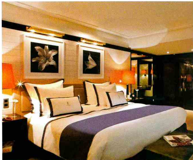
Всего в отеле 349 номеров и сьютов.